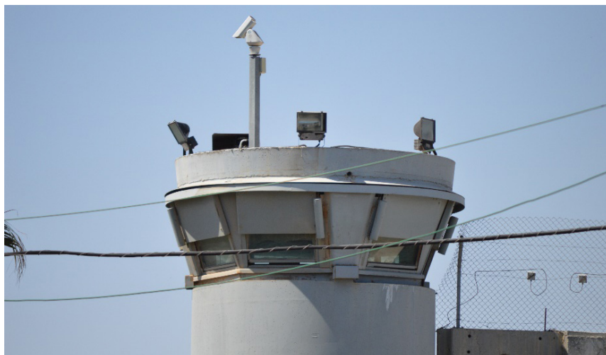
FIGURA 2. Torre de control sobre el mur a Betlem (Teodoro 2015).

A més i damunt, aquest dispositiu posseeix elements al seu voltant que recorden alguns dels trets atribuïts al panòptic. D'entrada, algunes de les seues seccions, com és el cas d'aquella situada al nord de Beit Sahour, estan defensades amb sensors a fi de registrar el moviment al seu voltant (Bowman 2007: 128). De més a més, al llarg del seu recorregut se situen torres de control, algunes d'elles coronades amb càmeres de vigilància. Amb tot, hi ha un fet que intensifica la presència del poder als ulls del palestí que ho sofreix. Segons Foucault, l'efecte major del panòptic és «induir en el reclòs un estat conscient i permanent de visibilitat que garantezca el funcionament automàtic del poder. Fer que la vigilància siga permanent en el seus efectes, encara que discontinua en la seua acció» 3 (Foucault 1975: 202-203). Així, des del terra, observant els vidres, hom no pot arribar a discernir si efectivament hi ha algú registrant l'activitat en aquella cabina. La barrera, doncs, elevada per sobre de la perspectiva individual, domina l'espai i genera la sensació d'una supervisió sense fi.